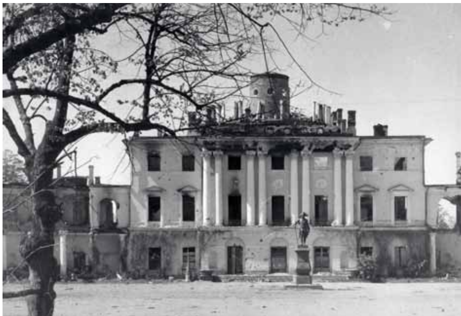
Павловский дворец, разрушенный войной

войны, открыв которые можно было увидеть их сегодняшнее состояние, аудиоэтикетки с записанными интервью реставраторов, лайтбокс с изображением парадного вида Павловского дворца.