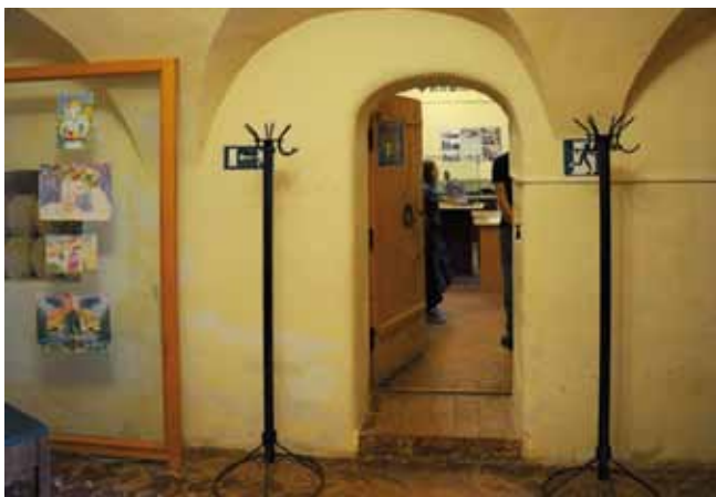
Исходные условия — два маленьких по площади и невысоких помещения